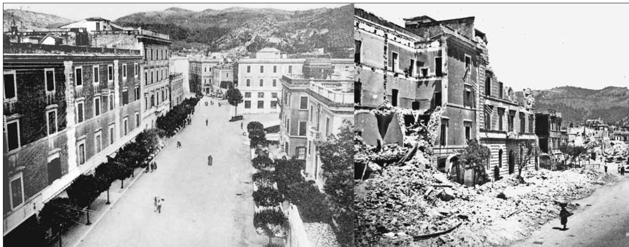
A sinistra piazza Garibaldi prima del bombardamento. L'area era caratterizzata sulla sinistra dai tre imponenti edifici Tigliè, Viola e Todini, abitati dalla borghesia cittadina. Essi sorgevano sulla superficie delle attuali fontane monumentali. A destra gli stessi edifici dopo la duplice incursione della mattina del 26 maggio 1944 (archivio F. D'Alessio).

Per la comprensione del documento è necessario un accenno al contesto bellico che durante il mese di maggio e i primi di giugno 1944 caratterizzava la campagna della II World War in Italia. Il 12 maggio 1944 la linea difensiva germanica Gustav, che da Ortona sull'Adriatico finiva a Gaeta sul Tirreno, con caposaldo Montecassino, veniva sfondata dalle divisioni anglo-americane dopo circa nove mesi di stallo. Iniziava così la ritirata dell'Armata germanica di decine di migliaia di uomini comandata dal Feldmaresciallo Kesselring.