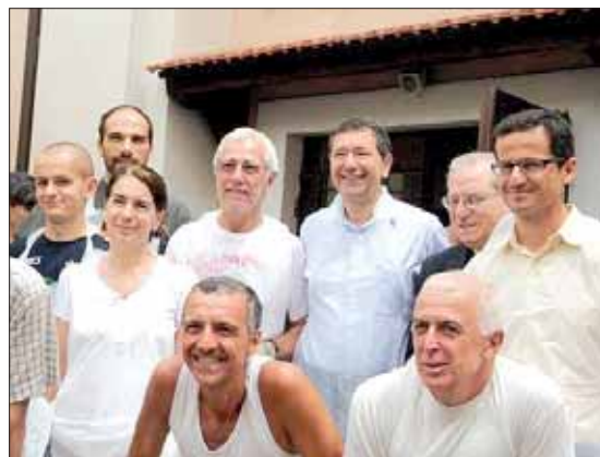
Orange in servizio alla Caritas insieme al Sindaco Ignazio Marino

Altre notizie e foto su www.podisticasolidarieta.it per scrivere podistica.solidarieta@virgilio.it per info 3382716443