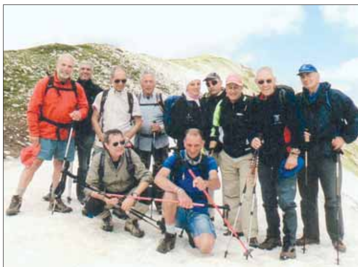
In vetta al Costone del Ceraso e, qui sotto, la salita al "Sebastiani" di Piani di Pezza