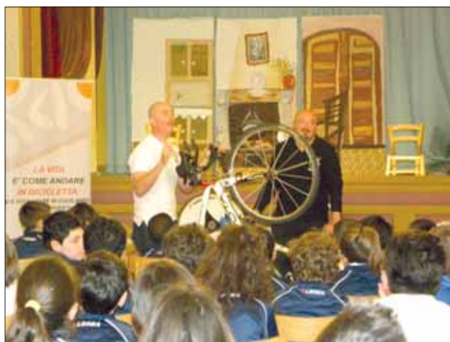
Teatro Scuola «San Getulio»

Escursione a Monte Catillo - Un gruppo di alunni e alcuni docenti fanno una tappa.