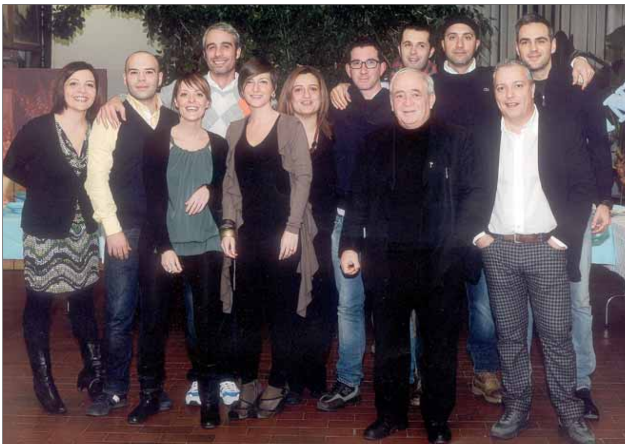
Ecco un gruppo di invitati a una cerimonia. Alcuni hanno scoperto di essere stati alunni di Don Benedetto e ci è scappata una bella foto ricordo!