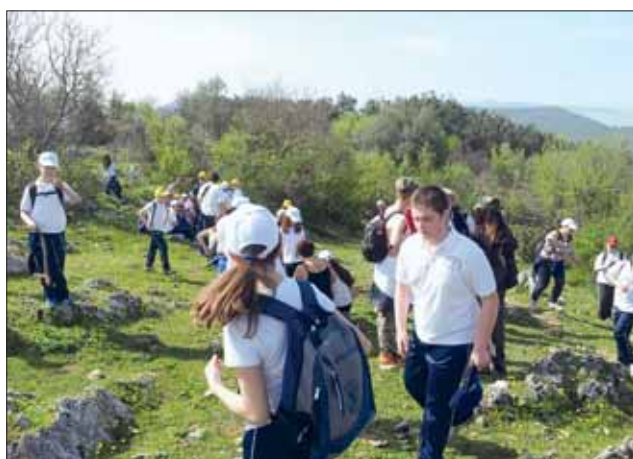
15 aprile 2013 - Progetto "Il Paesaggio"

Un gruppo di alunni fa esperienza di Nordic Walking .