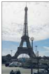
La torre Eiffel