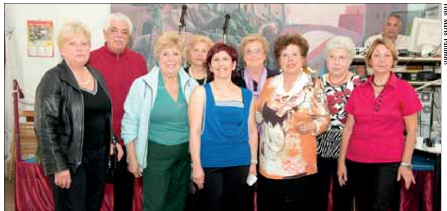
Le altre allieve che hanno frequentato il Corso di ballo

L'occasione è servita per ricordarci che Acquapendente è la Città della