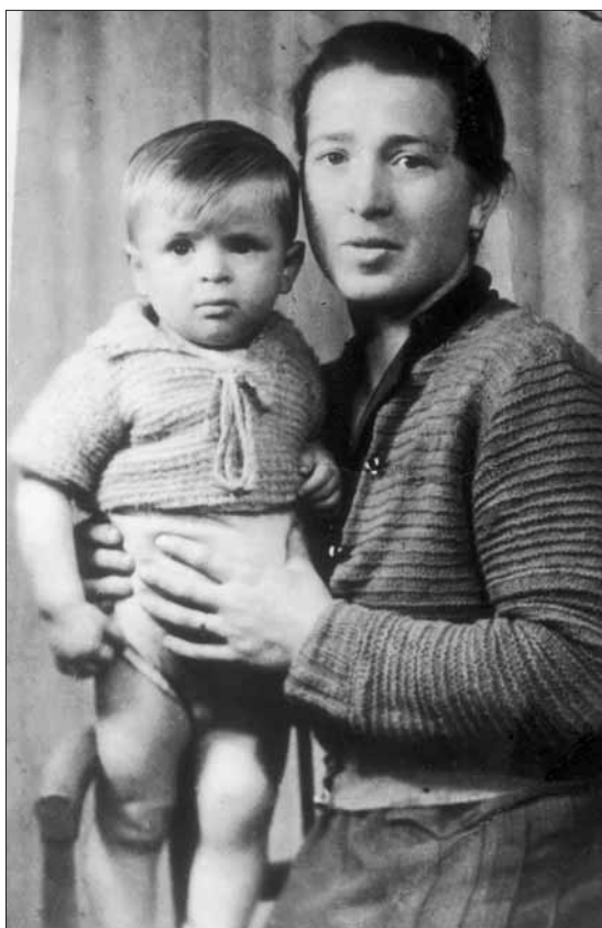
qui è con la sua mamma