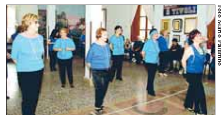
A partire dall'alto: le «Sorelle Bandiera» e l'inizio del saggio