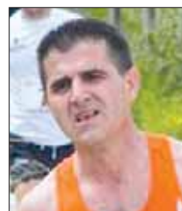
Silvestro Costantini Trail di Vallinfreda