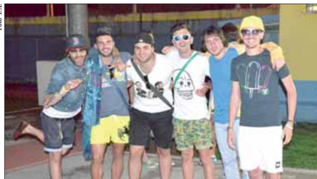
La sfilata di moda

L'11 luglio 2013 si è conclusa la II edizione del torneo Beach Volley 2013 organizzato da Geppo Night Beer e la CSS Tivoli , nella splendida cornice del vecchio Ripoli; al torneo hanno preso parte 16 squadre maschili e 8 squadre femminili.