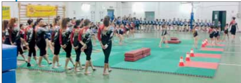
Le atlete durante la presentazione del saggio Qui sotto le atlete durante il saggio