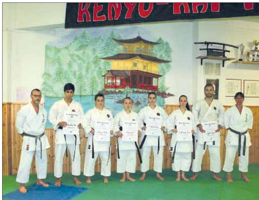
Nelle foto: gli esami per il passaggio di DAN

Blindline 16, London Calling, Masotti, Didì sport, Nicoletti, Ottica Raffaele Berti, Ristorante da Sanorina, Pizzeria La Stazione, La Tenuta Rosolina di Lollo Francesco, Pizzeria Twin, i Parrucchieri Peruzzini, Sole e Luna, Contesta Parrucchieri, Ristorante Viva L'oste, Sempre di Corsa, Aurum Gioielleria, Zenzero Risto Pub, Revolution, Math at Mome Academy. Ha partecipato alla sfilata anche il Club Vespa Valle dell'Aniene.