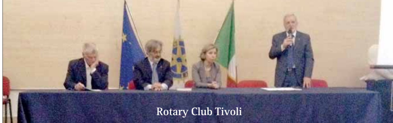
Rotary Club Tivoli