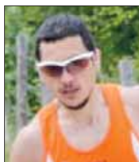
Giorgio Bizzarri Trail di Vallinfreda