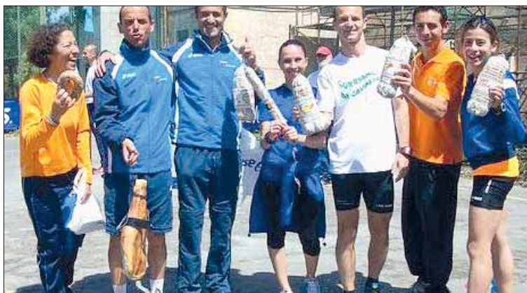
I nostri Orange vincitori di categoria alla Corriamo nella Tenuta del Cavaliere