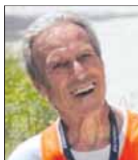
Elio Dominici Trail di Vallinfreda