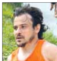
Alessandro Micarelli Trail di Vallinfreda