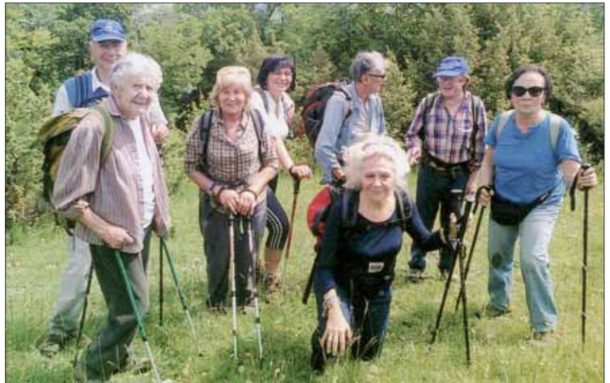
La gita dei Seniores

Tra le altre gite di giugno, il 30 un bel gruppo ha raggiunto la vetta della Cimata della Cerasa (2.150 m) e della Costa della Tavola (2.182 m) nel grup-