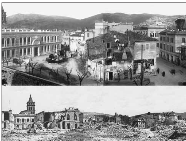
Foto sopra: fotografia unica scattata nell'inverno 1932 dall'ing. Emo Salvati - podestà interinale nel 1936 -. La veduta, ripresa con una macchina a lastre di vetro 10x15 cm, dal terrazzo dell'ultimo dei tre edifici che occupavano l'attuale superficie delle fontane monumentali, abbraccia un angolo che va dall'originario ed elegante edificio del Convitto Nazionale all'attuale inizio di via Aldo Moro. Sullo sfondo a sinistra è via Boselli verso Villa d'Este, mentre sulla destra è l'inizio della vecchia via S. Croce, corrispondente attualmente al vicolo cieco dell'ingresso al vecchio Cinema Teatro Italia. Il corpo centrale dell'immagine corrisponde attualmente all'edificio del Bar Arist e alla via Vincenzo Pacifici (conc. Francesco Perini).