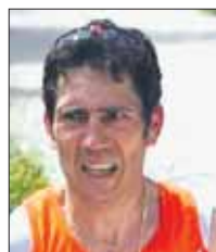
Luigi Mauro Trail di Vallinfreda