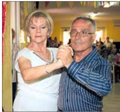
Gli insegnanti e qui sotto i protagonisti del ballo

Ha poi precisato che tali manifestazioni forse possono anche apparire lontane dalle problematiche dei ragazzi del C.I.S., ma sono molto importanti, al di là dell'eventuale risultato economico, perché servono a richiamare la nostra attenzione su alcune realtà che spesso si tende a ignorare mentre dovrebbero essere alla base di ogni nostro pensiero, formare la nostra coscienza e guidare ogni nostro gesto quotidiano.