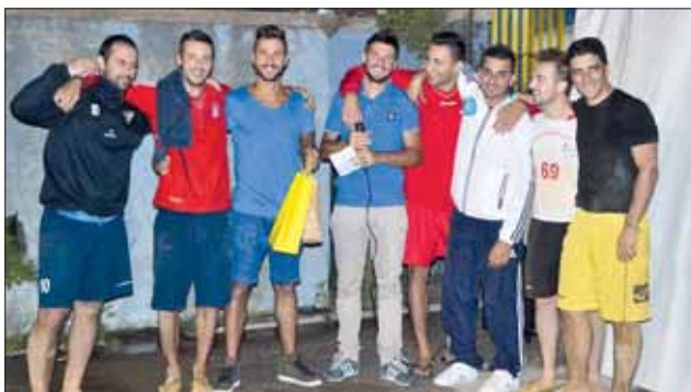
Il momento della premiazione