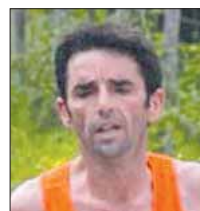
Roberto Costantini Trail di Vallinfreda