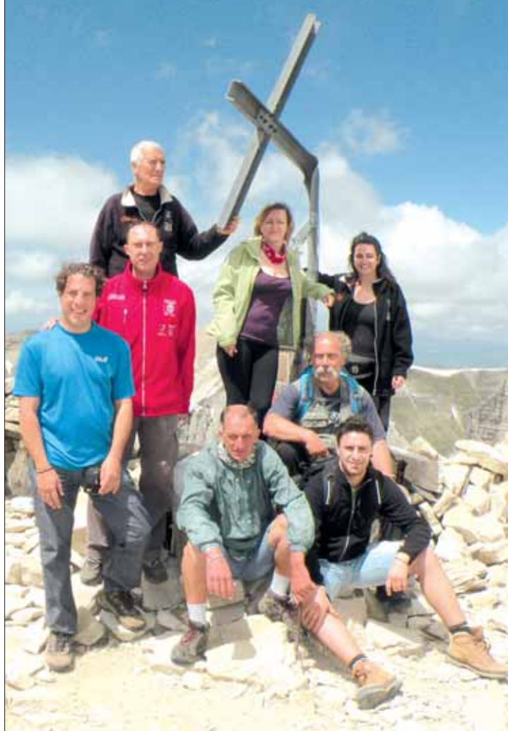
In cima al Monte Vettore