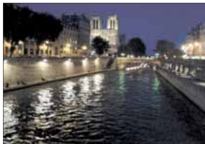
La cattedrale di Notre Dame vista dalla Senna