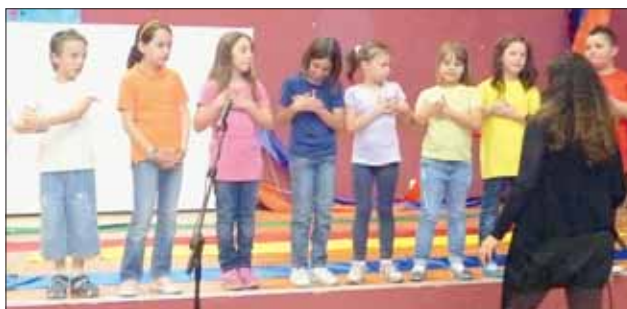
Il piccolo «Coro Arcobaleno»