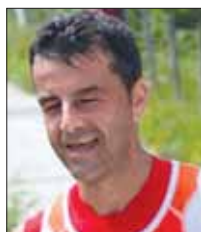
Luigi Valeri Trail di Vallinfreda