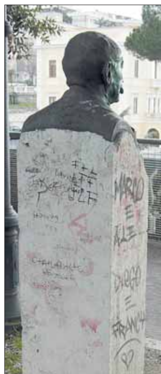
Nelle foto qui sopra: il busto in stato di abbandono ai Giardini Garibaldi.