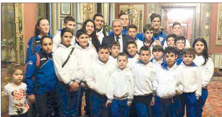
Il presidente del Senato con i piccoli Judoka