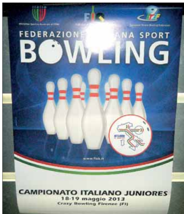
Crazy Bowling di Firenze 18-19 maggio 2013 Campionato Italiano Juniores.