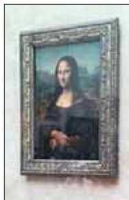
La Gioconda esposta al Louvre