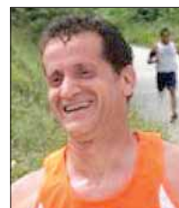
Giuseppe Tirelli Trail di Vallinfreda