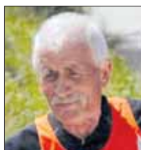
Giovanni Golvelli Trail di Vallinfreda