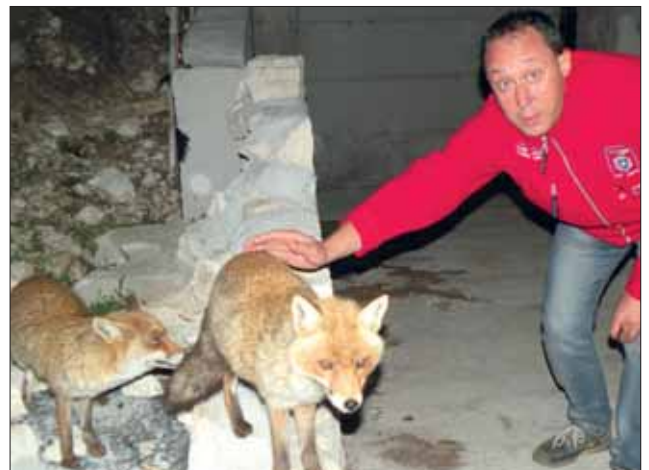
Gli "amici" dei Sibillini