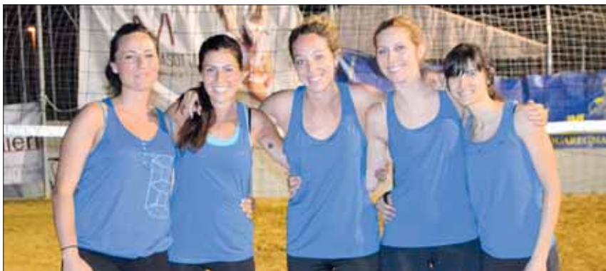
Le Mine Vaganti