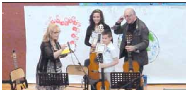
La premiazione dell'esibizione di chitarra