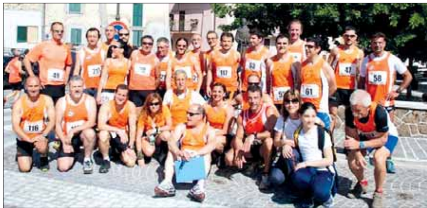
Orange al Trail di Vallinfreda