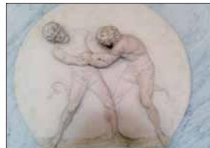
Bassorilevo di due lottatori esposti al Louvre