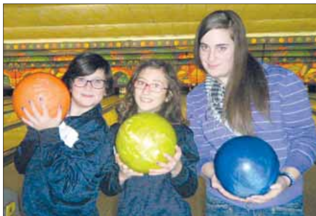
Bowling Brunswick di Roma