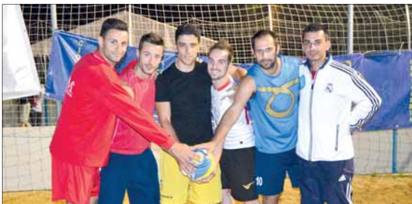
Libe S. Banca