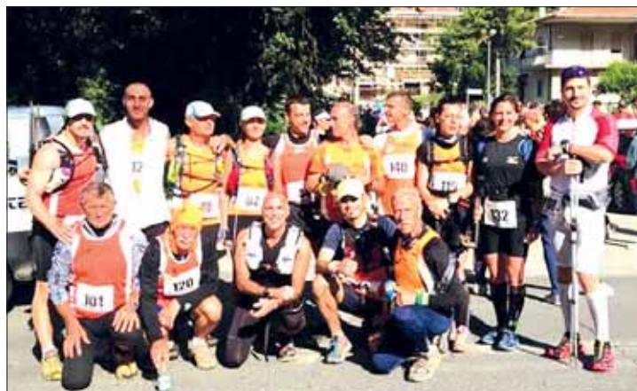
Orange alla Terminillo Sky Race