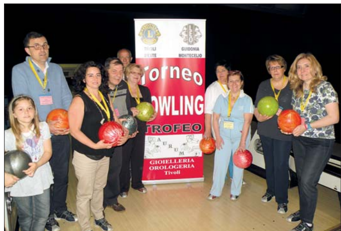
Il torneo di Bowling