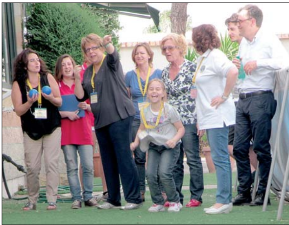
Il torneo di Bocce