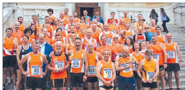
Gli Orange alla Race for Children