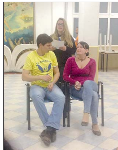
Le prove a Tivoli

Per chi volesse seguirci o contattarci «L'Officina dei Talenti» ha una pagina Facebook https://www.facebook.com/officinadeitalenti e un sito internet http://lofficinadeitalenti.weebly.com/