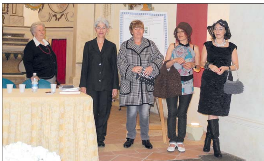
Le nostre modelle

Si ringraziano per la collaborazione i comuni di Castel Madama, Cinetto Romano, Licenza, Mandela, Roccagiovine, San Polo dei Cavalieri, Per-