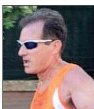
Race for the Cure Marziale Feudale