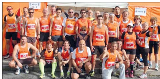
Gli Orange alla Rome For Dialogue