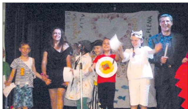
Piccolo coro «Arcobaleno»