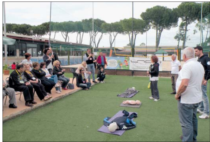
La dimostrazione dei «Volontari per te»