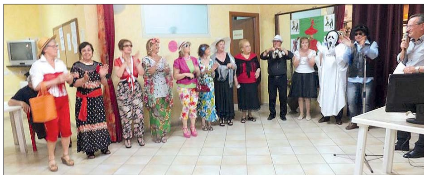
Serata de «La Corrida»