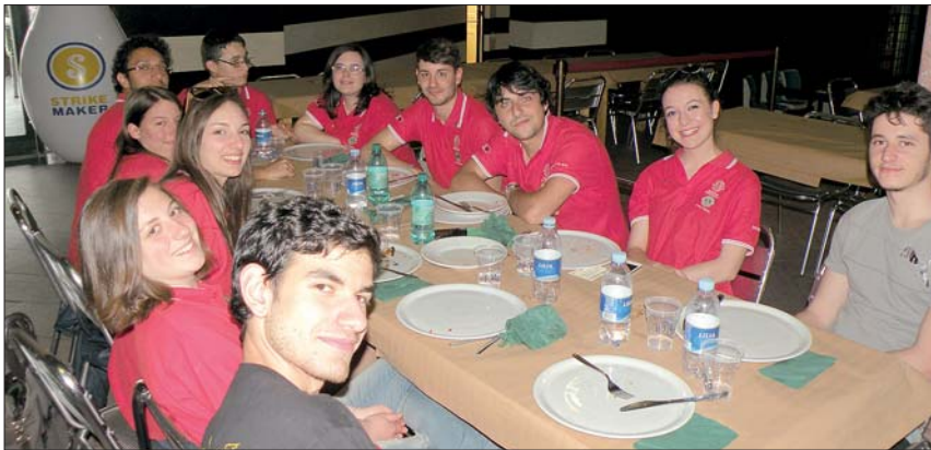
Il «Leo Club»

L'arrivederci al prossimo anno è quanto mai doveroso, visto l'entusiasmo mostrato da tutti i partecipanti che avranno così 364 giorni per preparare la sfida ai campioni vincitori di questa prima edizione.