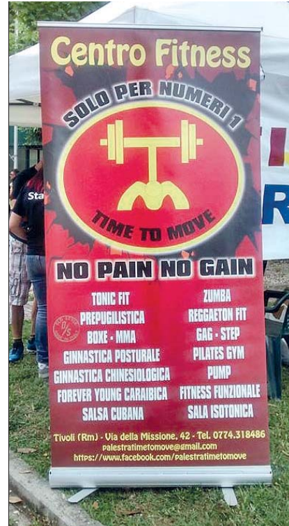
Il banner nel Parco Andersen