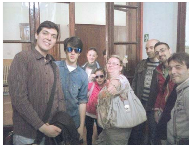
Una parte dei componenti de «L'Officina dei Talenti» in procinto di ripartire