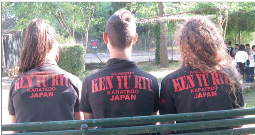
Stage Bambini e Ragazzi 2014