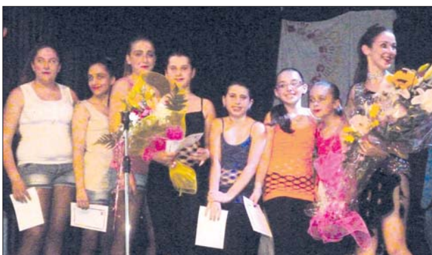
Corso di ballo