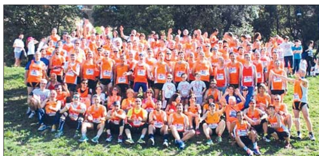
Gli Orange alla Race For the Cure - Lotta contro i tumori al seno