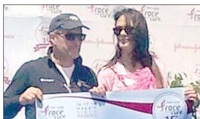
Race for the Cure - La premiazione 1° posto nella gara competitiva