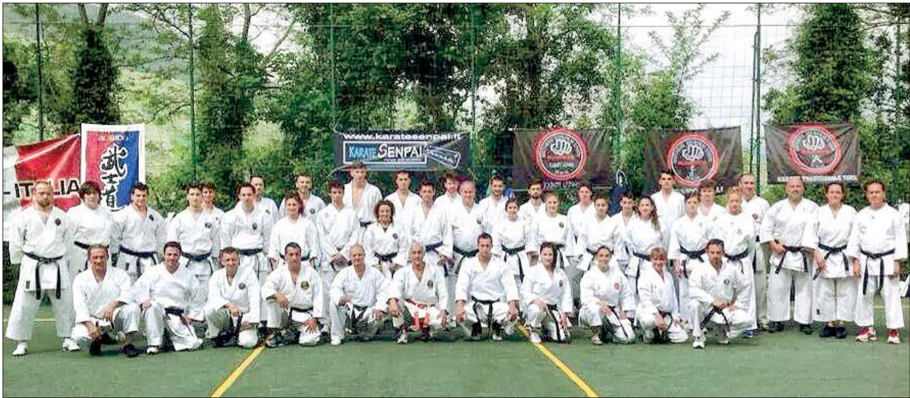
Il gruppo delle cinture nere

avete letto bene!) protraendo l'attenzione e la vita in comune sino a tarda serata.