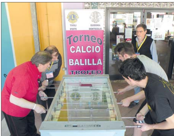
Il torneo di Calcio Balilla