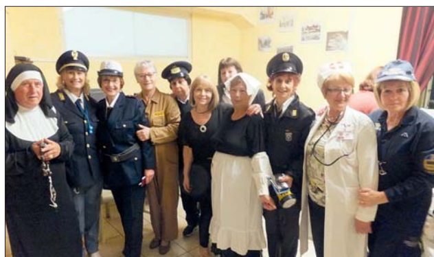
Gruppo sfilata mestieri