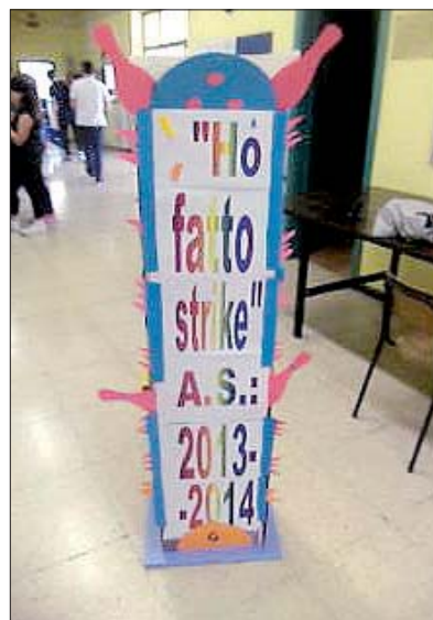
I lavori dei ragazzi della «V. Pacifici» sul tema del bowling in esposizione a scuola Qui sotto il pannello con foto, pensieri e disegni dei ragazzi