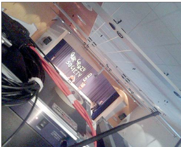
Le prove a Napoli