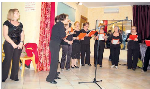
Il coro del Centro