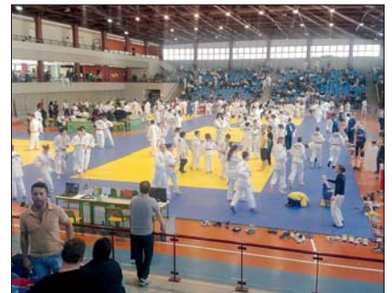
Gli atleti in riscaldamento prima della gara