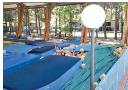
Le atlete si divertono durante una pausa della gara