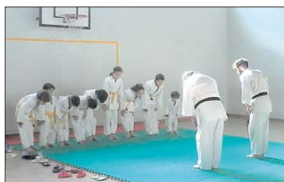
Uno dei gruppi di ragazzi dell'Istituto «Igino Giordani»