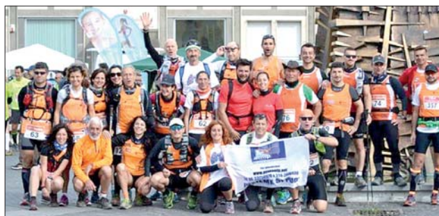
Gli Orange alla Tibur Ecotrail