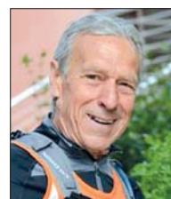
Tibur Ecotrail Elio Dominici

poli di Rosarno (RC) tristemente nota per i soprusi e le sopraffazioni. La situazione della tendopoli è sintetizzata in un articolo su La Repubblica del 16 dicembre 2013: «Se non trovi un "padrone" che ti fa raccogliere le arance o i mandarini per 20 euro al giorno, diventa persino più dura di quello che è normalmente. Devi essere bravo a raccogliere, veloce e preciso. Non devi rovinare gli alberi e devi avere un caporale a cui stai simpatico. La simpatia si traduce in due semplici parole: "forza" e "silenzio". Arrivano con i furgoni alle 6 del mattino, li caricano e poi li distribuiscono