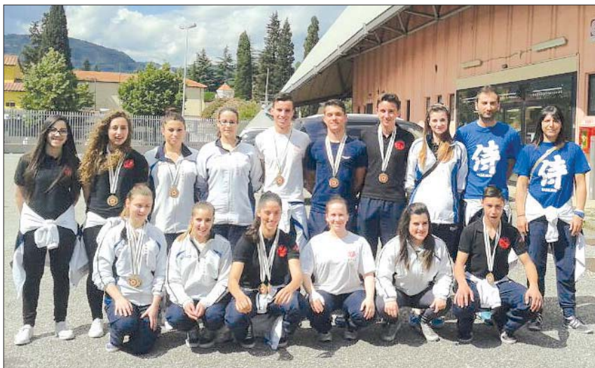
Memorial Carlo Henke

Siria: «Anche quest'anno lo stage è stato spettacolare! la cosa più bella secondo