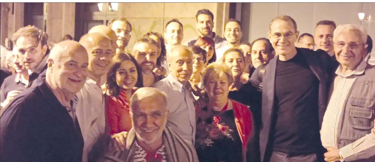
Tivoli, alle prime ore del 9 giugno - Una delle prime foto del nuovo Sindaco