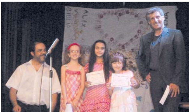
Corso di pianoforte

Per maggiori informazioni su tutte le attività dell'Associazione, rivolgersi in Segreteria nei giorni di martedì e giovedì - dalle ore 18,00 alle 20,00 - oppure consultare il sito www.assoarcobaleno.it e lasciare il proprio indirizzo di posta elettronica dove si potranno ricevere tutte le informazioni e novità. Si ricorda, infine, che all'interno dei locali dell'Associazione è allestita una piccola biblioteca che è a disposizione del pubblico nei giorni di martedì e giovedì dalle ore 18,00 alle 20,00. I testi presenti sono tutti stati gentilmente offerti da ragazzi e genitori, che ringraziamo: invitiamo altri che vogliono disfarsi di qualche libro "impolverato" a donarlo all'Associazione per far sì che la lettura e la conoscenza possano essere condivise. L'Associazione Arcobaleno vive grazie al tempo, all'impegno, alle capacità e alla professionalità che alcune persone mettono a disposizione attraverso il proprio ruolo e le proprie propensioni, incontrandosi con individui affini. Per questo motivo abbiamo bisogno anche di te e delle tue idee: più siamo, meglio riusciremo a capire, interpretare e soddisfare i bisogni del nostro territorio. INSIEME POSSIAMO.