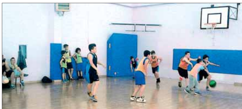
Incontro di Mini Basket

Giochi da Tavolo e Tornei di Ping pong e Burraco - Rassegna Cinematografica.