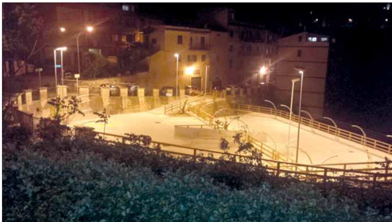
Veduta notturna del nuovo parcheggio in Piazza Antonio Felici

Il nuovo impianto intitolato al politico sampolese Antonio Felici