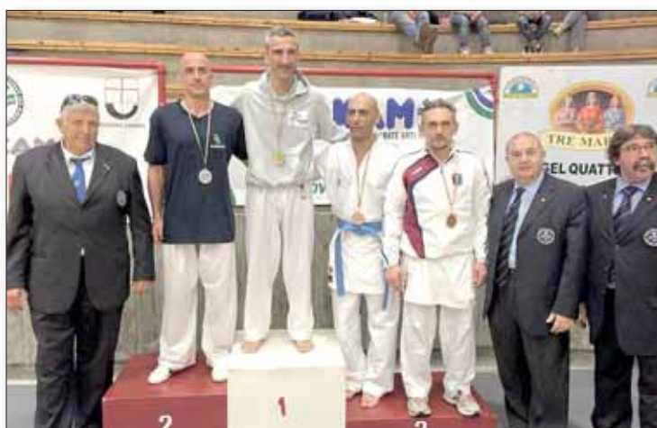
Carmine medaglia di bronzo