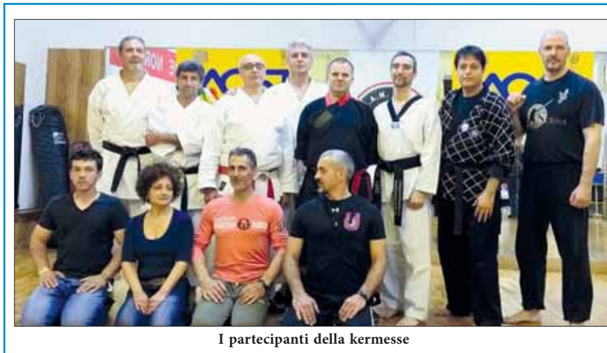
I partecipanti della kermesse