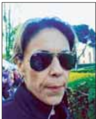
Elena Trulli Appia Run