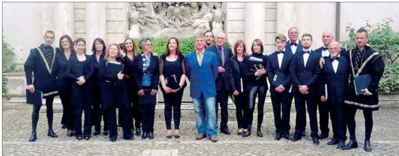
La Corale «Arcobaleno»

Le forme musicali praticate sono: il MOTTETTO, la MESSA, l'INNO, il SALMO e le varie forme liturgiche, il MADRIGALE, la CHANSON francese, e a carattere popolare: la VILLANELLA, la CANZONETTA, il BALLETO. L'attività musicale si svolge