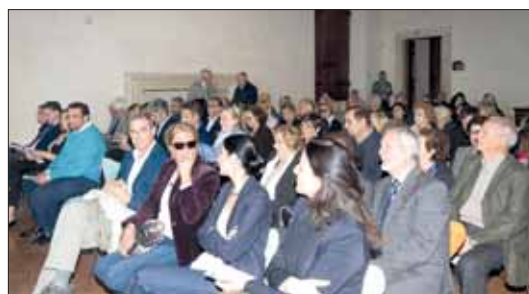
La sala gremita di pubblico