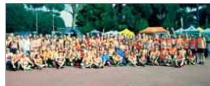
Orange all'Appia Run