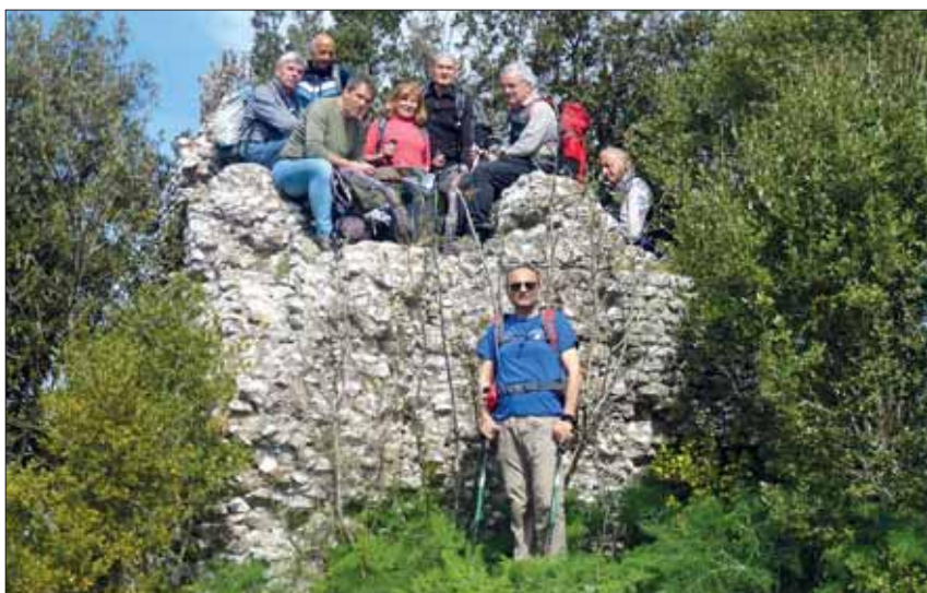
La Casaccia dei Ladri

Una escursione di una bellezza sorprendente, di rara cultura storica, dal 500 passando per il medioevo fino ai giorni nostri, dove tutto si confonde con lodevole magia tra natura, storia, arte e panorami in cui l'incanto è un'emozione spontanea senza parole.