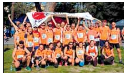
Orange al Vivicittà di Latina