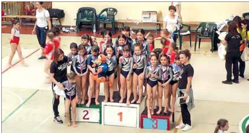
Le piccole allieve sul podio dopo la gara con le medaglie