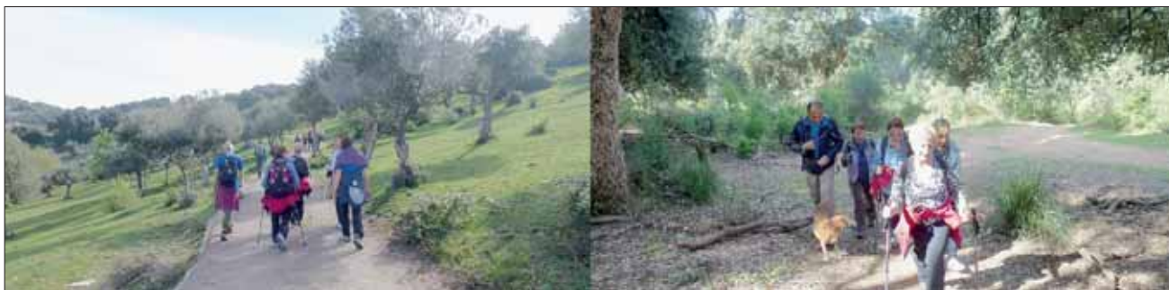
Alcuni soci lungo il percorso Don Nello Del Raso

Testo: Virginio Federici