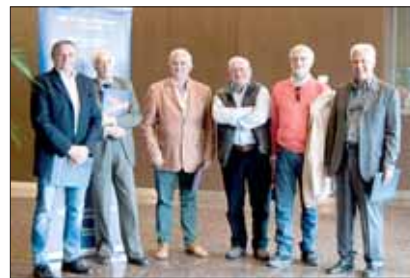
Una parte del gruppo di Tivoli