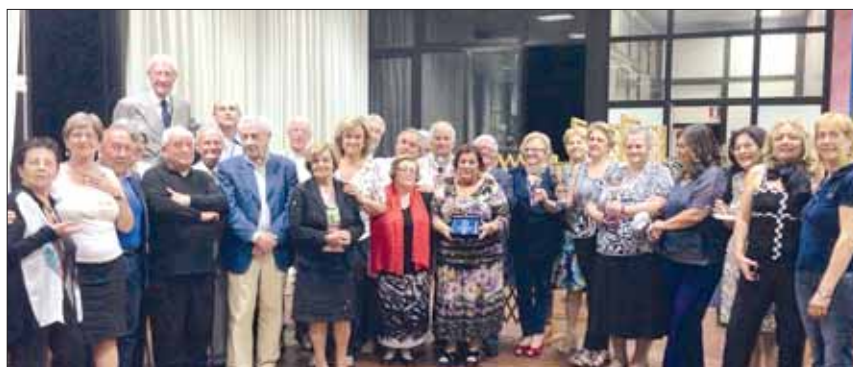
I soci Lions e i gruppi del Burraco