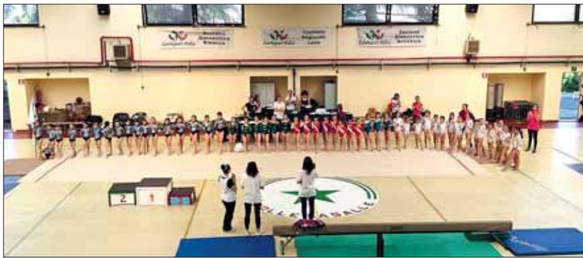
Le piccole allieve prima della gara