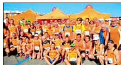
Orange al Granai Run