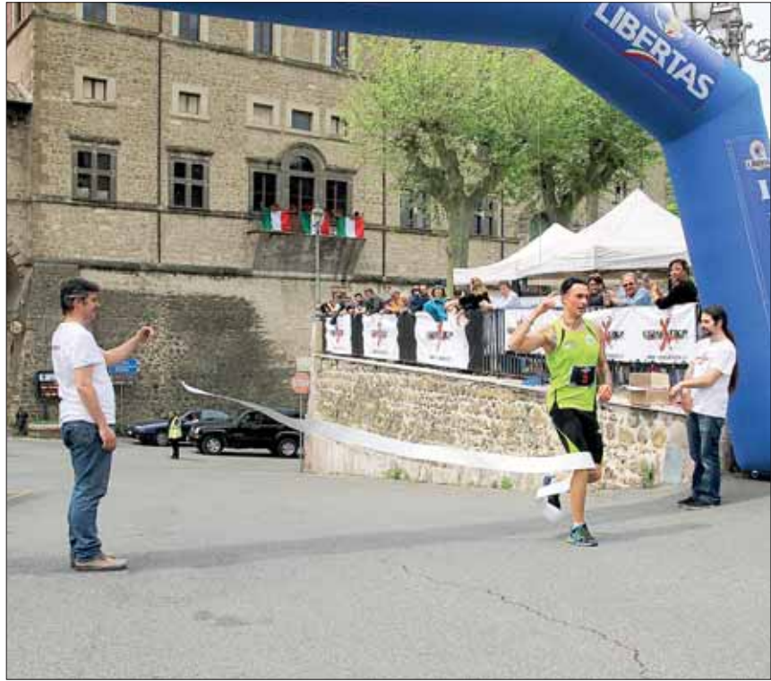
Foto e commenti sulla pagina Facebook del Gruppo Escursionistico Monte Kailash.

Ovviamente i dovuti e sentiti ringraziamenti vanno a tutte le persone che hanno collaborato e in particolare modo all'associazione Aefula e agli sponsor che hanno permesso di colmare quel vuoto economico di un Gruppo di amici autofinanziato.