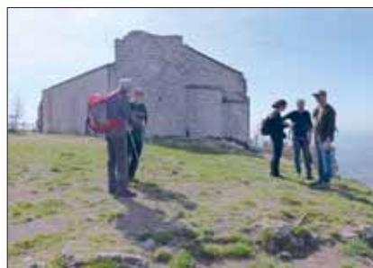
Davanti all'Eremo di S. Silvestro