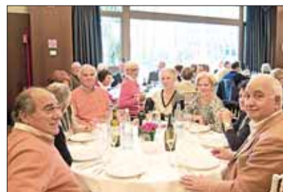
Gruppo di Tivoli a pranzo

tutti ciò è sembrato una soluzione adeguata.