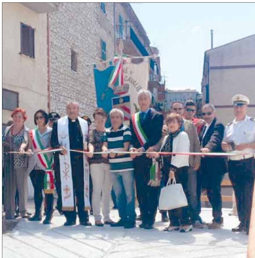
Il taglio del nastro tricolore

È una soluzione di ingegneria naturalistica per sostituire l'utilizzo del cemento con materiali di riempi-