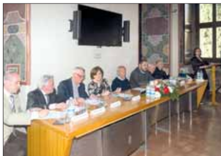
Il tavolo dei relatori