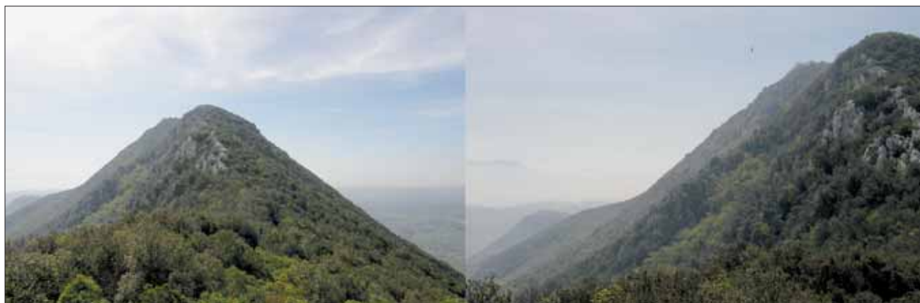
Il Monte Soratte visto da due direzioni

Testo e Fotografie: Luigi Santarelli Accompagnatori: Pasquale Cola- buono e Virginio Federici