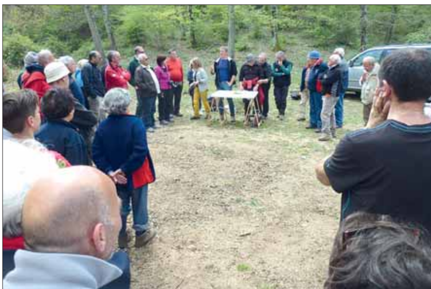
Inizia la cerimonia della premiazione