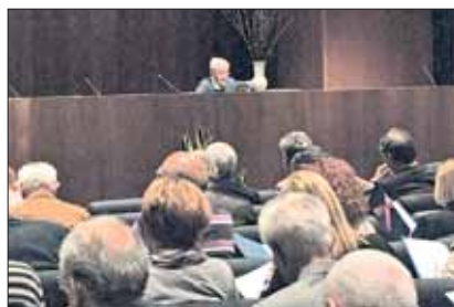
Il Vicepresidente e la platea attenta