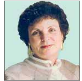
Il coordinatore del Collegio di Garanzia