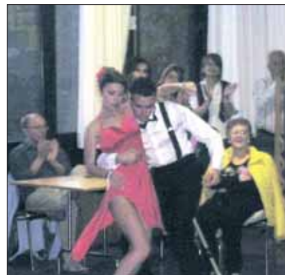
17 maggio 2015: serata Tango