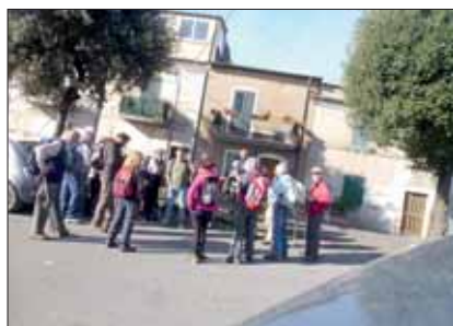
Prima di partire da S. Oreste

Si prosegue il sentiero fino al maso di S. Nonnosio, uno sperone di roccia rivolto verso la valle della Flami-