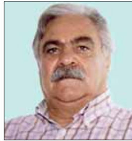
Il Presidente Ruggero Costantini

Le preoccupazioni per queste elezioni erano tutte rivolte al raggiungimento del quorum necessarie per non ripeterle e di conseguenza si sarebbe perso altro tempo per arrivare alla soluzione. A questo punto non rimane altro che augurare al Nuovo Comitato buon lavoro per questi tre anni di mandato. Durante il periodo post-e-