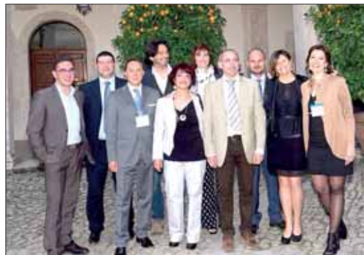
Lo staff di «Innovanda»