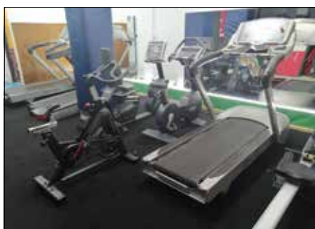
Le varie sale rinnovate.

Al rientro dalle ferie vi invitiamo a riprendere i vostri allenamenti o a iniziare con Noi il nuovo anno sportivo: a TTM Sport Academy in Agosto abbiamo ampliato la sala isotonica migliorando l'utilizzo degli spazi per esercitare il proprio piano di allenamento in piena comodità, abbiamo ricavato una nuova area cardiofitness e ammodernato la sala sport da combattimento, arti marziali e corsi ad alto impatto che ha ora un nuovo tatami, un'illuminazione specifica maggiore, nuove postazioni di lavoro per sacchi o supporti per l'allenamento oltre a un ring 4 per 4 dove poter condurre le sedute di Sparring , quindi un taglio più performante e tecnico sia per chi volesse praticare arti marziali che per i nostri allenamenti di Boxe e Prepugilistica pensato per migliorare la qualità delle lezioni. Aspettiamo, ricchi di entusiasmo, chiunque volesse, per provare gratuitamente le nostre attività che quest'anno vanno nel pomeriggio incontro a un'offerta tutta volta per l'età evolutiva di puro avviamento