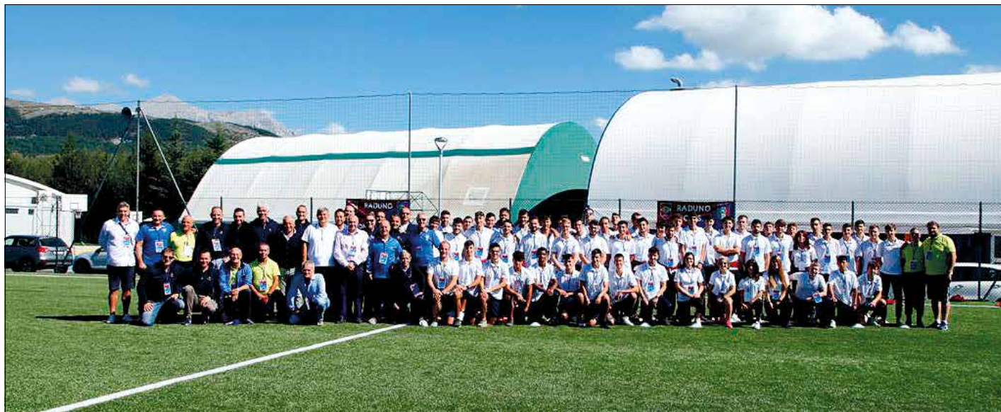
L'organico OTS al completo.