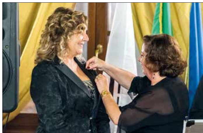
Il Governatore accoglie la neo socia.

Il mese di Settembre per il Tivoli d'Este Guidonia non è solo il momento della programmazione, ma anche quello della più importante ricorrenza per un Lions club: il festeggiamento della Charter.