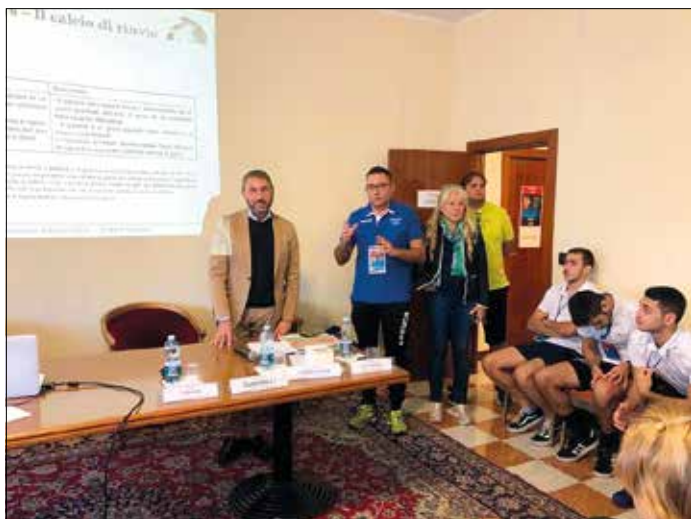
Il saluto del sindaco di Tagliacozzo.