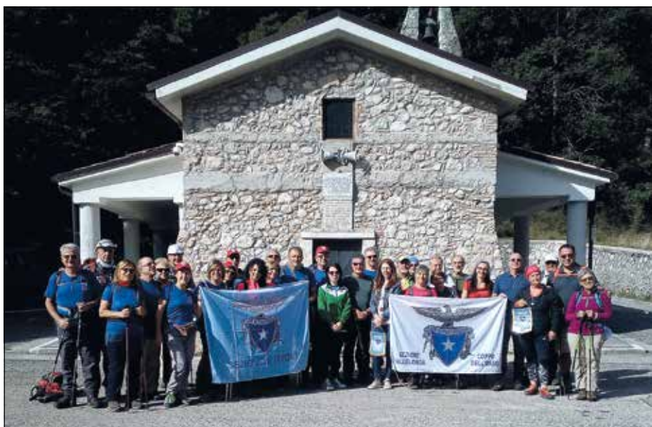
Madonna della Lanna.