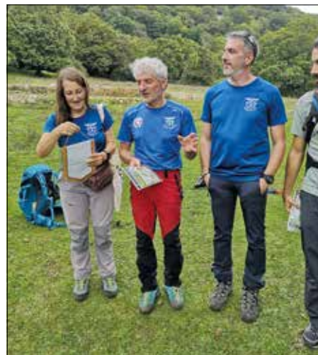
Con il CAI Amatrice.