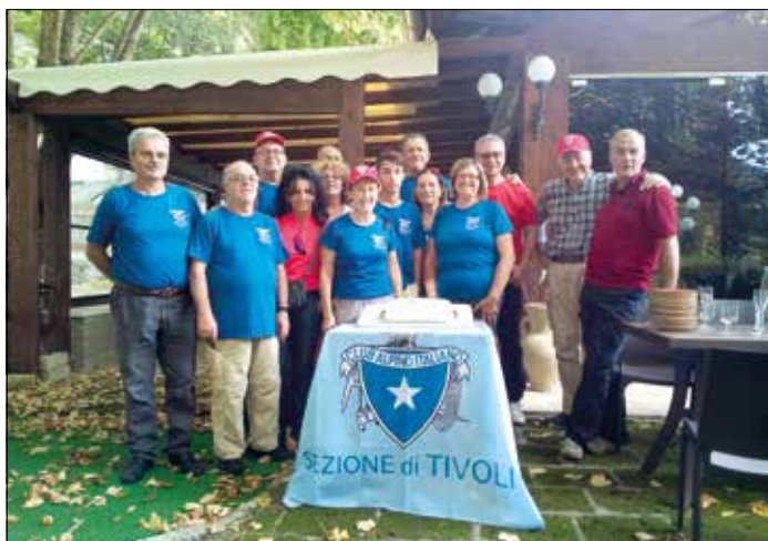
Festa della Sezione.