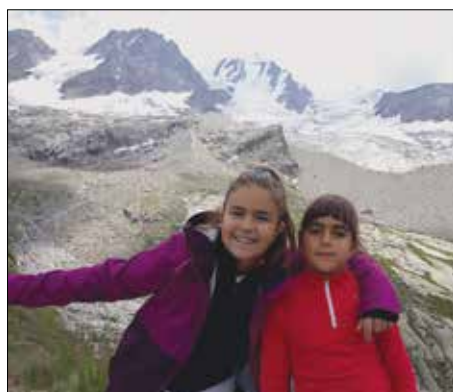
Da sinistra: Piccolo Paradiso (m 3.926) - Gran Paradiso (m 4.061) - Ghiacciaio di Laveciau.

scalato, superando alcuni passaggi esposti, la Becca d'Aver di 2.469 metri, da dove hanno ammirato, come da un elicottero, un fantastico panorama con il Cervino a sinistra, il Monte Rosa al centro e l'intera Valle d'Aosta in basso a destra.