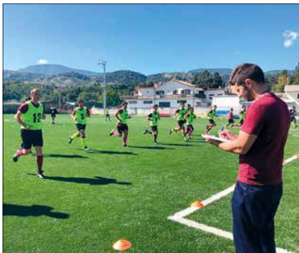
Gli arbitri tiburtini alle prese con lo Yo Yo Test.