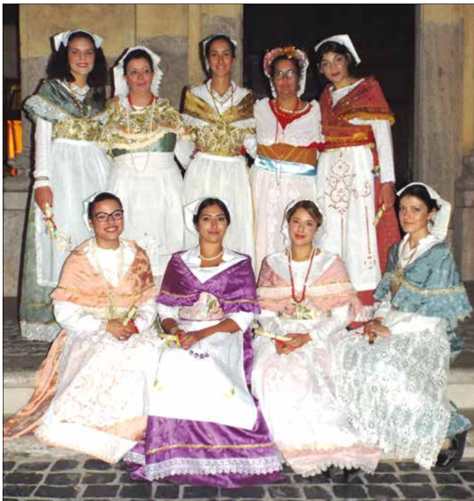
Foto in alto: le donne nel tradizionale costume santangelese all'interno del teatro "La pace" di Montecelio.

A sinistra: le stesse, nelle loro caratteristiche 'nnelle, davanti alla chiesa di S. Giovanni.