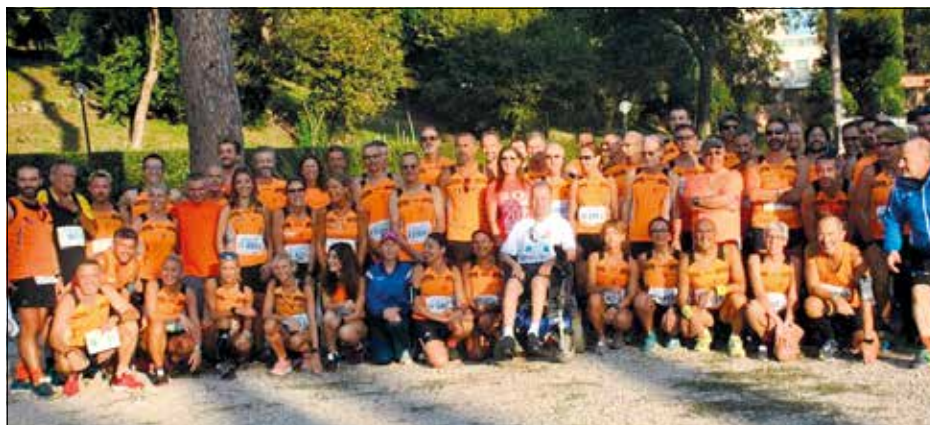
Gli Orange alla Corri Roma.